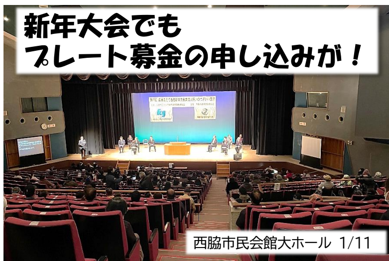
西脇市民会館大ホール 1/11